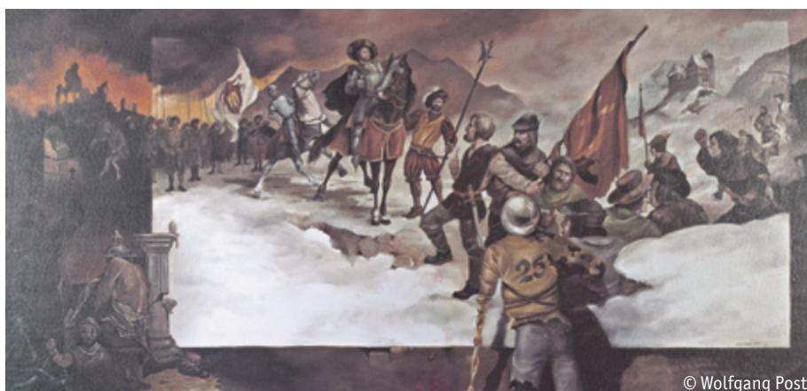
Wolfgang Post: „Sonthofer Tag“, 1987