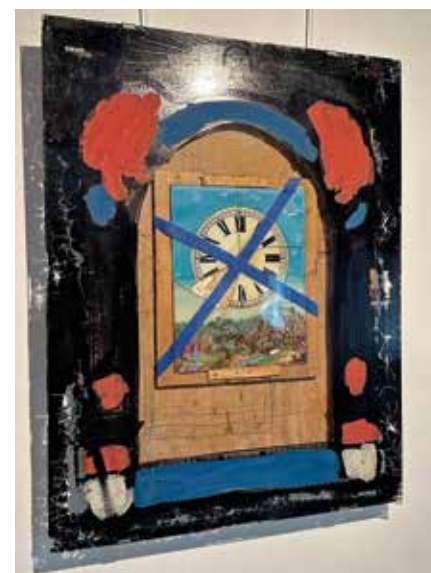
„Ich bin die Zeit der Welt“, 2024