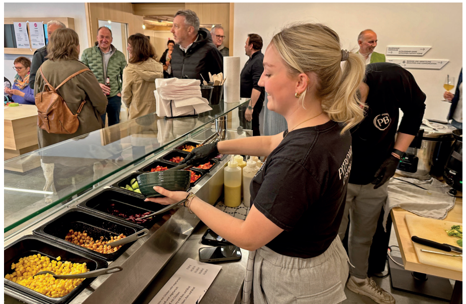
Gut besucht war die letzte After-Work-Veranstaltung im AlpenStadtMuseum.

Jeden 2. Dienstag im Monat 15:00 Uhr (nach Vereinbarung). Anmeldung bei Verena Freuding Tel. 08321/6601-22.