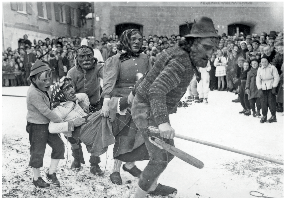
Eggaspiel 1955

in Sonthofen ist von 1952 bis 1963 belegt) verbinden die beiden Künstler.