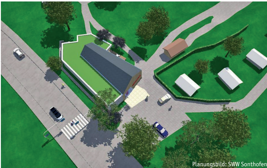
Planungsbild: SWW Sonthofen

Die Perspektive zeigt den Vorentwurf des neuen Jugendhauses am Tannachwäldchen